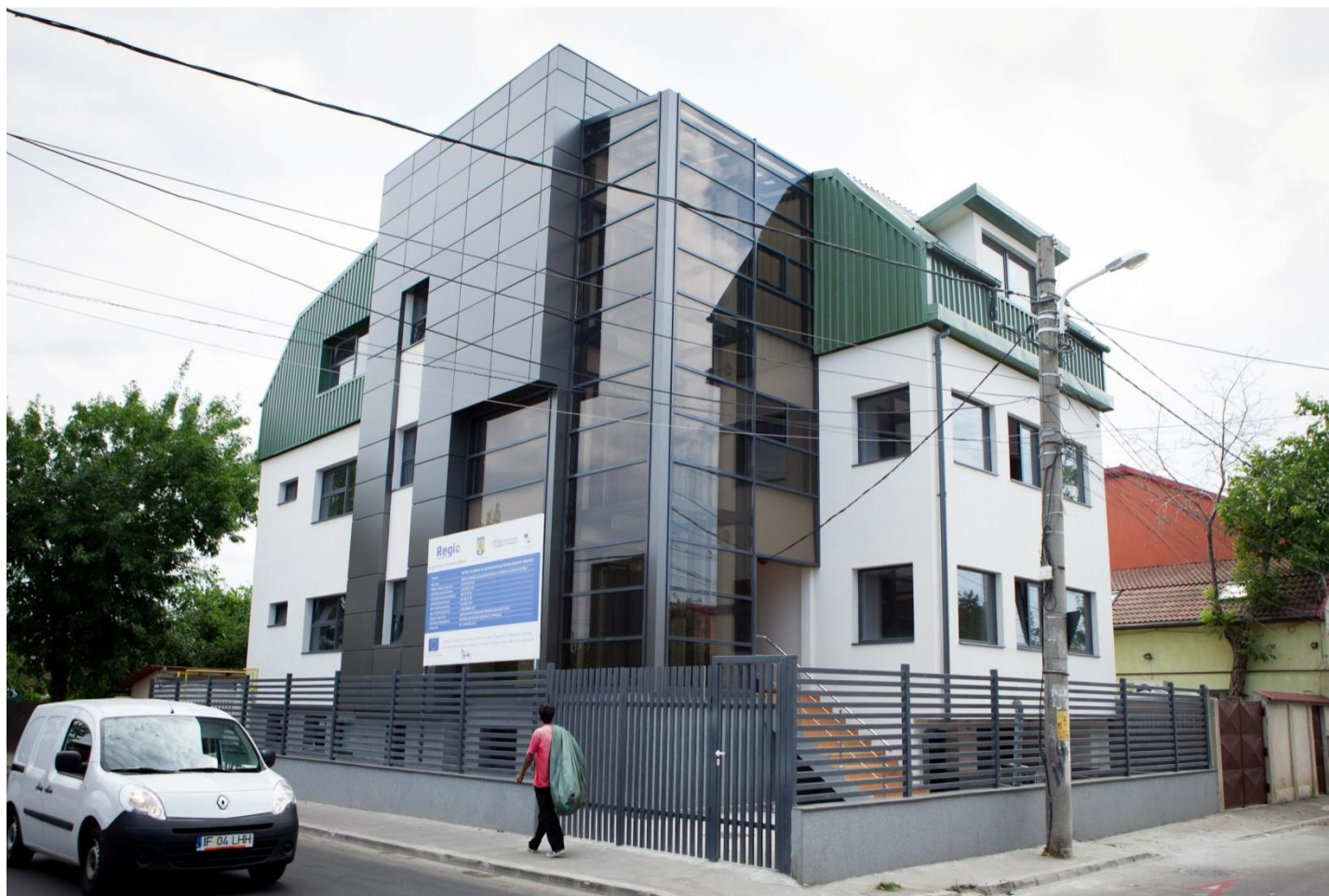
Centrul de servicii de asistenta sociala pentru persoane varstnice - DGASPC sector 2